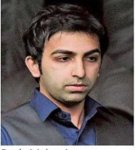
Pankaj Advani. * FILE PHOTO