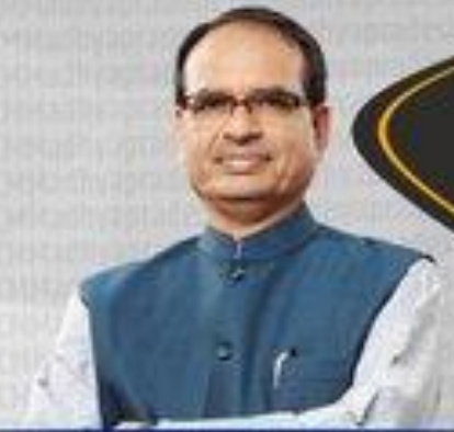
Shri Shivraj Singh Chouhan Chief Minister

45 highway projects of road length 1361 Kms worth over Rs 11,000 crore