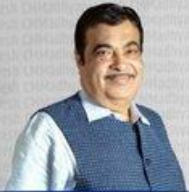
Shri Nitin Gadkari Union Minister Road Transport & Highways